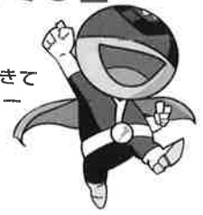
滋賀県人権啓発キャラクター ジケンダー