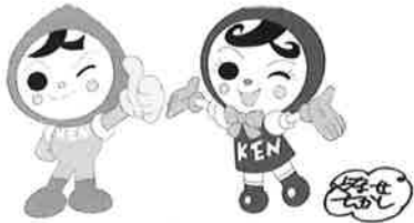
人権イメージキャラクター 人KENまもる君、人KENあゆみちゃん

14:30 スタート 手話ダンス 大型紙芝居 トークショー 15:00 頃 大型紙芝居 人権紙芝居 15:30 頃 パルーンアート 16:00 頃 終了